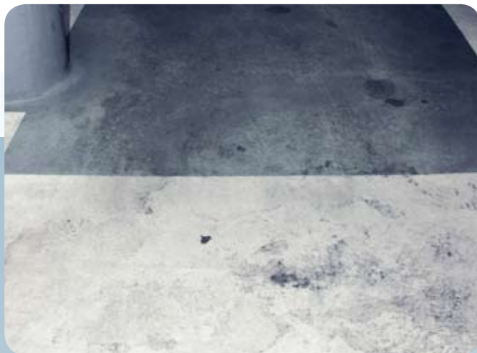
1 · Vorher

Wir von N+P beraten Sie gerne und erarbeiten mit Ihnen gemeinsam Reinigungskonzepte, die Ihren Anforderungen in der Parkhaus- und Großflächenreinigung 100%ig Rechnung tragen.