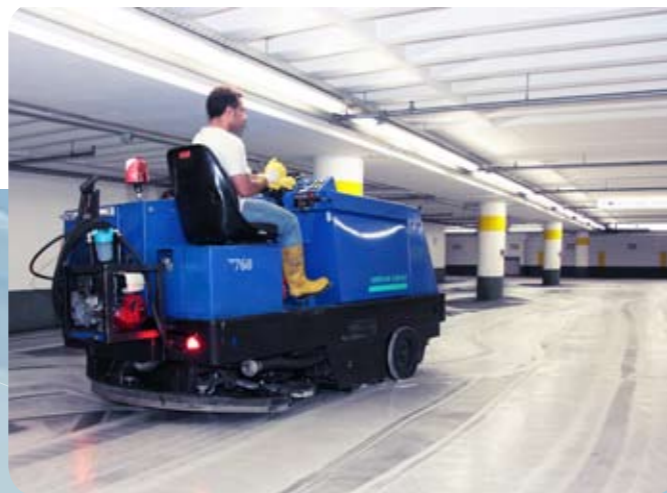
2 · Chemische und mechanische Reinigung