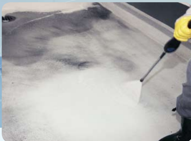
3 · Hochdruckreinigung