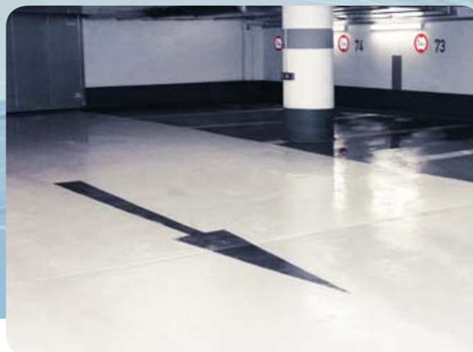
4 · Nachher